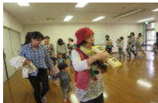
汽車に乗って、出発～トンネルくぐって…

まだ1歳なので集中して見られないのでは?と思ったけれど、キラキラした目で、私のひざの上で最後まで楽しんでました。