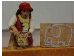
ゾウさんが、カバさんに「このマスクはどう？」

劇遊びは子どもの脳に良い。子どもは、「見えないもので遊ぶ力(ごっこ遊び)」や、「やりたいことを、自分からやる力」など、すごい力を持っている。それを大切にして、親子のふれあいをたくさん持つてほしい。